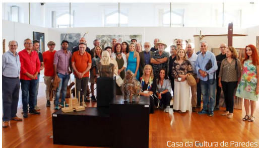
Casa da Cultura de Paredes