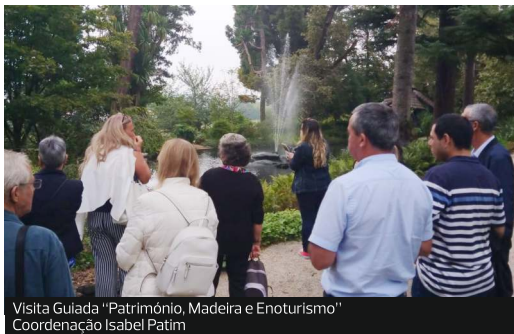
Visita Guiada "Património, Madeira e Enoturismo" Coordenação Isabel Patim

Exposição Coletiva – Bienal Internacional das Artes em Madeira de Paredes Direção Artística: Agostinho Santos | Curadoria: Felícia de Sousa