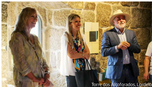
Torre dos Alcoforados, Lordelo

Exposição Coletiva – Bienal Internacional das Artes em Madeira de Paredes Direção Artística: Agostinho Santos | Curadoria: Felícia de Sousa