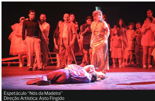
Espetáculo "Nós da Madeira" Direção Artística: Asto Fingido