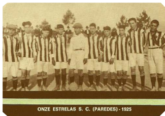
ONZE ESTRELAS S. C. (PAREDES) - 1925

Organização: Câmara Municipal de Paredes